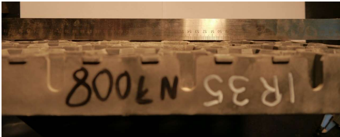
Fot. 7. Krata IR 35 po obciążeniu 800 kN