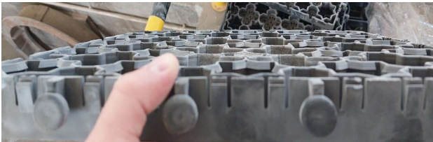
Fot. 3. Krata IR 35 po obciążeniu 57,5 kN