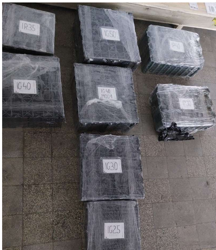
Fot. 1 Próbki do badań

Próbki dostarczono na palecie. W trakcie rozpakowywania nie stwierdzono żadnych uszkodzeń.