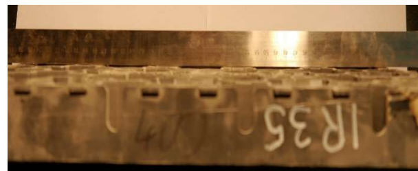
Fot. 6. Krata IR 35 po obciążeniu 400 kN