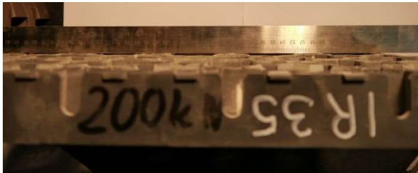
Fot. 5. Krata IR 35 po obciążeniu 200 kN