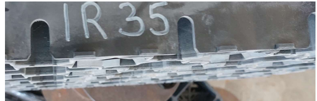
Fot. 4. Krata IR 35 po obciążeniu 80 kN